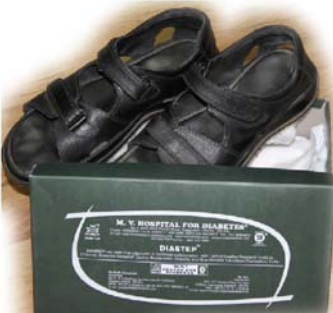
मेसर्स एमवी डाइअबीटीज हेल्थ केयर, चेन्नै को प्रौद्योगिकी हस्तांतरित

डाइअबेटिक्स के खतरे को कम करने के लिए फुटवेअर