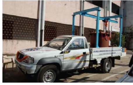
कार्कस ट्रांसपोर्ट व्हीकल