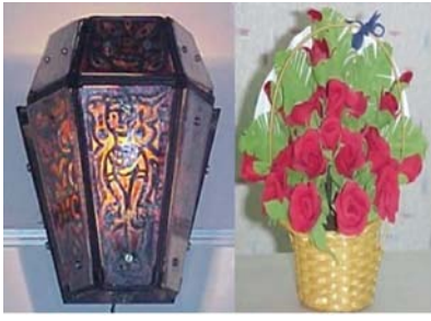
लैडर लैंपशेड और फ्लावर्स