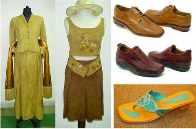
टॉप- एंड फैशन वेअर