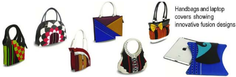
Handbags and laptop covers showing innovative fusion designs

नवोन्मेषी फ्यूजन डिजाइनों को दर्शाते हैं बैग्स और लेपटॉप कवर्स